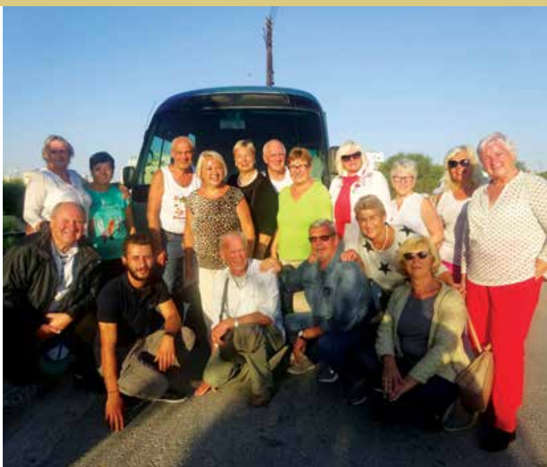
Penkios dienos, praleistos saulėtoje Kipro saloje, išvykos dalyviams paliko neišdildomą įspūdį.

Kartu su Kipro salos kurčiųjų prezidentais ir kurčiaisiais Tarptautinę kurčiųjų dieną šventė sostinės Nikosijos senamiesčio restorane „Katherine“.