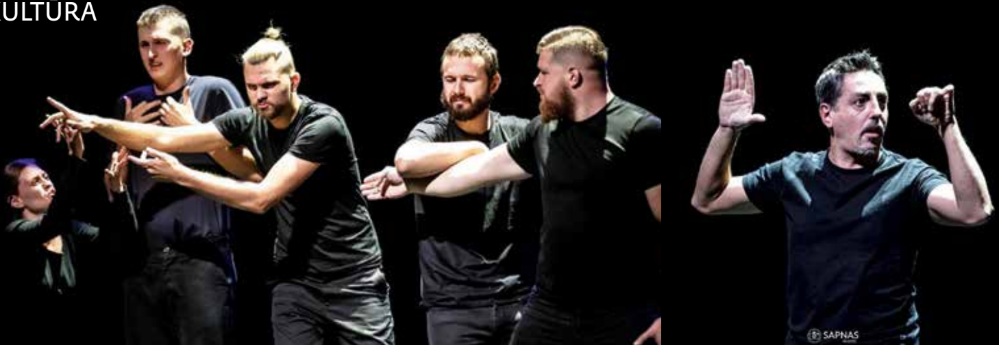
Buvo galima išvysti ir dviese, ir trise, ir net šešiese atliekamų poezijos kūrinių.