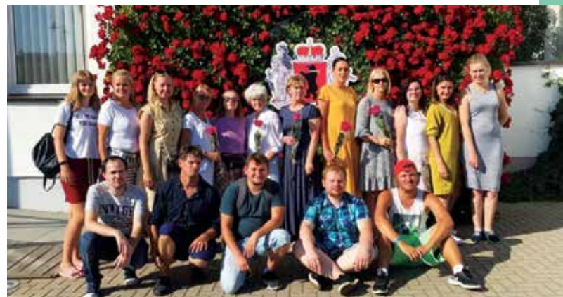
Buvę Telšių kurčiųjų mokyklos mokiniai ir mokytojai.

Be abejo, koks susitikimas, neaplankius tos vietos, kur sėdėta suoluose, kur sienos mena vaikų juoką, kur būta šurmilio ir liko daug prisiminimų. Planuota tik apžiūrėti pastatą iš išorės, bet vėliau nuspręsta