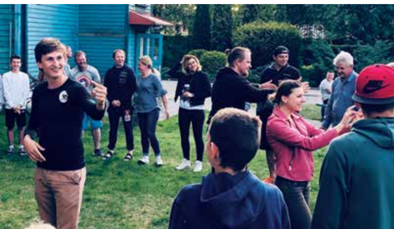
Klaipėdos savanoriai surengė vakarėlį be alkoholio.