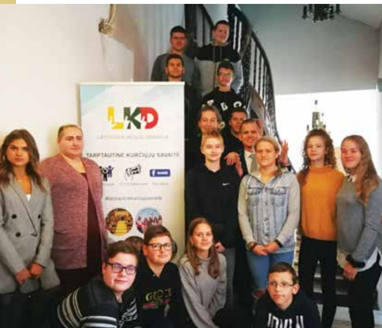
Kurčiųjų mokyklų mokiniai ir mokytojai Lietuvos kurčiųjų draugijoje.

Pasaulyje daugėja senyvo amžiaus žmonių, klausos negalios asmenys yra šios populiacijos dalis. Kai kurie senyvo amžiaus piliečiai gyvena senelių globos namuose arba slaugos namuose, kur jie gali džiaugtis ir mėgautis kitų žmonių draugiškumu, darbuotojais, kurie moka gestų kalbą. Tačiau nemaža dalis senyvo amžiaus žmonių gyvena izoliuotai, kur paslaugos nėra teikiamos gestų kalba. Valdžios institucijos privalo užtikrinti, kad vyresnio amžiaus piliečiams informacija būtų prieinama gestų kalba, o paslaugų teikėjai mokėtų gestų kalbą, kad kurtiesiems būtų suteiktos tokios pačios galimybės kaip ir visiems piliečiams. Ta linkme Lietuvos kurčiųjų draugijai dar reikia daug padirbėti.