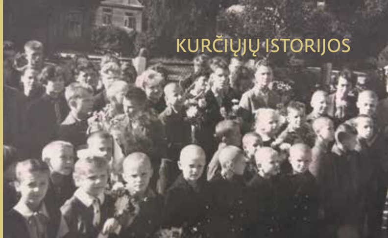
Rugsėjo pirmoji naujoje kurčiųjų mokykloje (Filaretų g. 36).