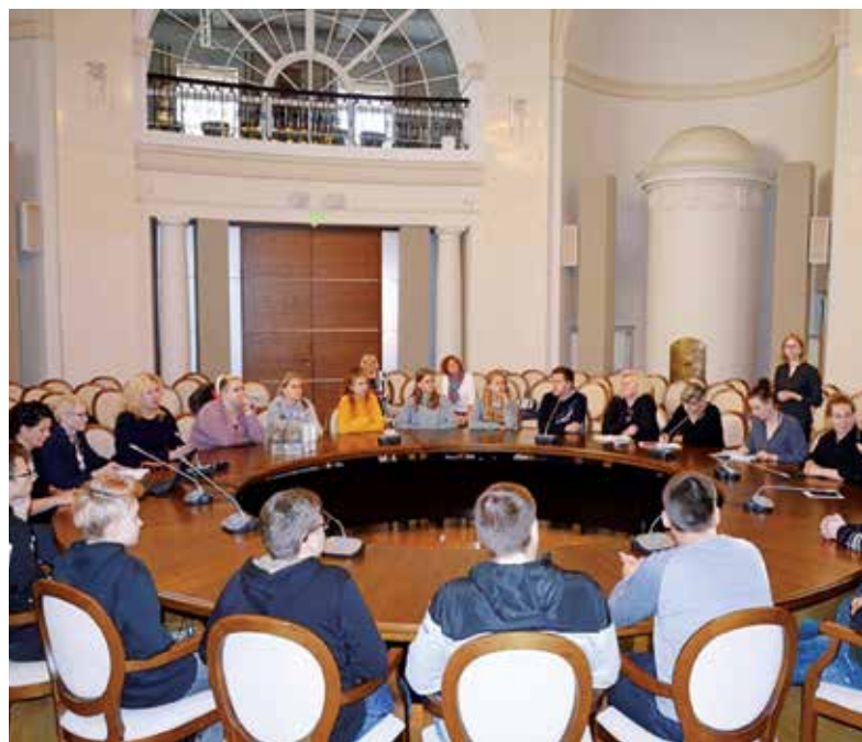
Mokiniai ir LKD atstovai Švietimo, mokslo ir sporto ministerijoje.