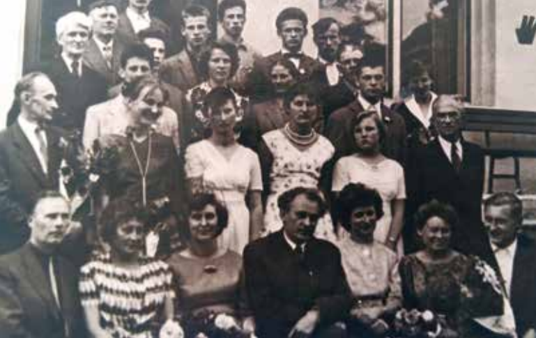
Pirmoji mokyklos laida 1961 m