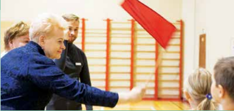
Prezidentė D. Grybauskaitė LKNUC paskelbė „Solidarumo bėgimo 2019“ pradžią ir davė pirmąjį startą