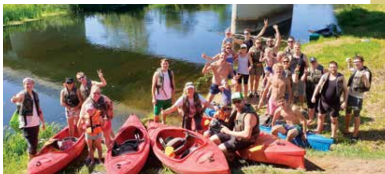
Panevėžio savanorės sukviėtė Lietuvos kurčiuosius į žygį baidarėmis.

Savanorių svarba draugijai išties didelė, o jos reikšmę pajausti galima organizuojant įvairius renginius. Rugsjūčio mėnesį LKD dalyvavo didelio masto festivalyje „Laisvės piknikas 2019“ Kaune ir ten pasakojo girdintiesiems apie gestų kalbą, supažindino su kurčiųjų kul-