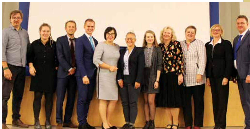
Tarptautinės konferencijos „Europos šalių pavyzdžiai, užtikrinantys kurčiųjų socialinę gerovę“ lektoriai ir organizatoriai.