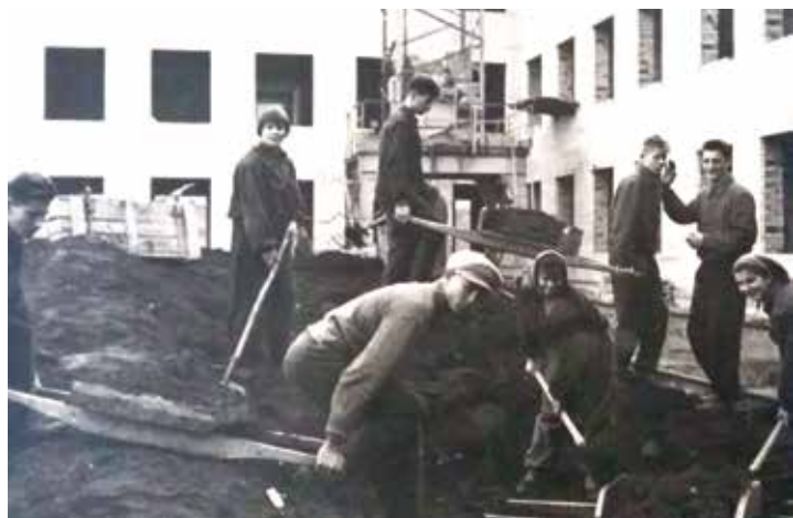
Statant mokyklą daug prisidėjo pedagogai ir mokiniai: talkininkavo statybininkams, kuopė statybines atliekas, dirbo kitus darbus.

1958 m. kovo mėnesį buvo padėti mokyklos pamatai. Mokyklos statybą finansavo tuometinė Švietimo ministerija. Statant daug prisidėjo pedagogai ir mokiniai: talkininkavo statybininkams, kuopė statybines atliekas, dirbo kitus darbus. Pedagogai privalėjo padirbėti po 50 valandų. Ir jie savo įsipareigojimus ne tik įvykdė, bet ir viršijo. Dide-