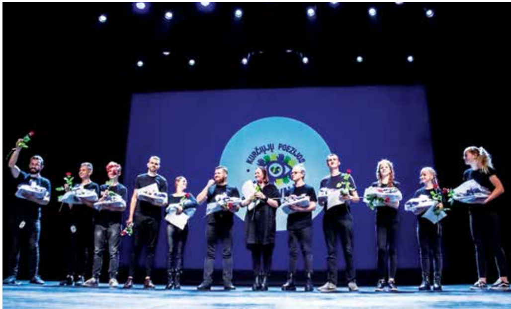
Kurčiųjų poezijos festivalio dalyviai.

Festivalyje nebuvusiems skaitytojams natūraliai kyla klausimas – ar kurčiųjų poezija nėra tiesiog gestų kalba perteikti rašytiniai kūriniai? Toli gražu. Kurčiųjų poezijoje gestų kalba net nėra vartojama. Kiekvieną posakį reikia perteikti vizualiai – rankų plas-